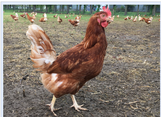
Mer uteplass per høne enn for et barnehagebarn.

logiske unghønene i Norge bare en vaksine på rugeriet (Marek), og en vaksine i oppdrettet (Paracox).