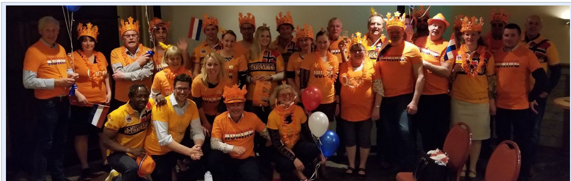
Studieturen endte i Amsterdam for å få med forberedelsene til Nederlands store nasjonalfeiring «Kings Day», deres bursdagsfeiring av kongen som overgår 17. mai en del hakk i forhold til «party-faktor».

Avslutningsvis passer det derfor å sitere en av uttalelsene til en av turdeltakerne. Siden det er fare for at vi med denne uttalelsen får vår egen «Gro Harlem Brundtland» i næringen, velger vi å ikke nevne navn: «En må ikke glemme at noen ganger er det greit å konstatere at det også er en god del områder vi ikke har så mye å lære - det er ikke kodd at vi driver litt i en egen klasse der hjemme i nord». ■