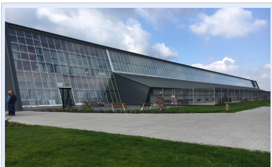
Kipster er et helt nytt konsept for verpehøns og et alternativ til Rondeel anleggene. Det minner om et stort veksthus fra utsiden. Anlegget er åpent for publikum 24 timer i døgnet.

«luftegården». Hele besøket på Kipster var en stor lærdom i hvilket potensial man har til å markedsføre hva eggproduksjon er ut til «folk flest» - det hele var en imponerende innpakning i layout, branding og markedsføring - her har vi mye å lære. Vi oppfordrer de andre leddene i vår verdikjede om å ta turen innom Kipster i Castenray så fort anledningen måtte by seg.