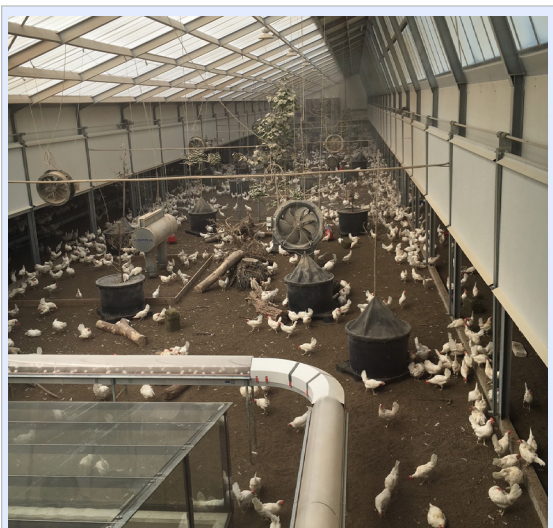
Innvending er det en stor vinterhage i midten og to aviarinnredninger på hver side av vinterhagen. På utsiden av aviarinnredningen var det et mindre lufteareal slik at hønene kunne gå ut i frisk luft.

Det er alltid gøy å dra til utlandet for å få innblikk i hvordan våre utenlandske kollegaer tenker og driver. I løpet av en slik tur, får de aller fleste noen nye ideer som de kan ta med seg hjem i sin egen drift. For de av oss som har vært noen år i bransjen merker man kanskje spesielt godt hvilken verdi den ufor-