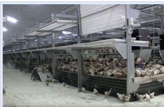
Etter hvert åpnes «riste-veggene» opp og gulvristene inne i anlegget heises. Dyrene må stadig bevege seg høyere i systemet for å få tilgang til vann og fôr utover i innsettet.